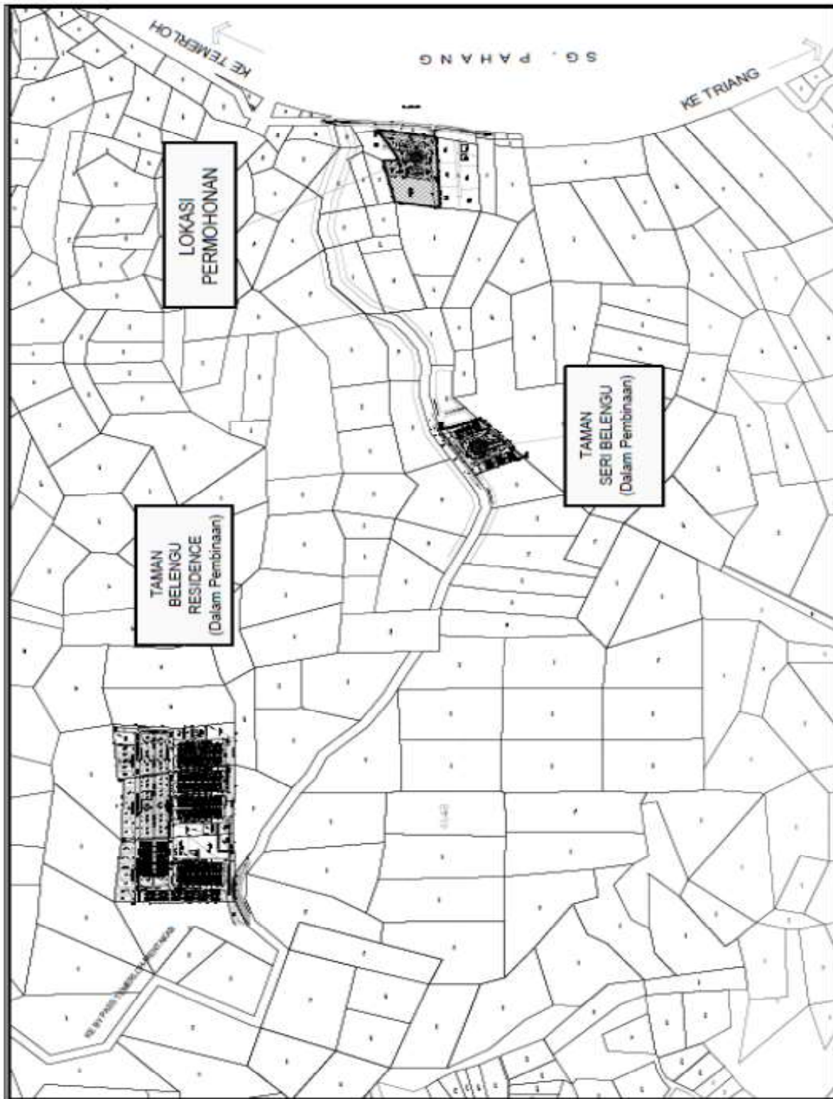
LOKASI KELULUSAN PERMOHONAN NAMA TAMAN, NAMA JALAN DAN NOMBOR BANGUNAN (TAMAN BELENGU IMPIAN) BAGI CADANGAN PEMBANGUNAN PERUMAHAN DI ATAS LOT 833 (GM 1185), MUKIM LEBAK, DAERAH TEMERLOH, PAHANG DARUL MAKMUR UNTUK TETUAN : EDISI SERIMAJU S/B